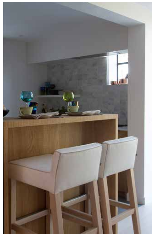
Een kleine keukentooij om te aperitiefen of in de pannen te kijken terwijl Marlies aan het koken is.