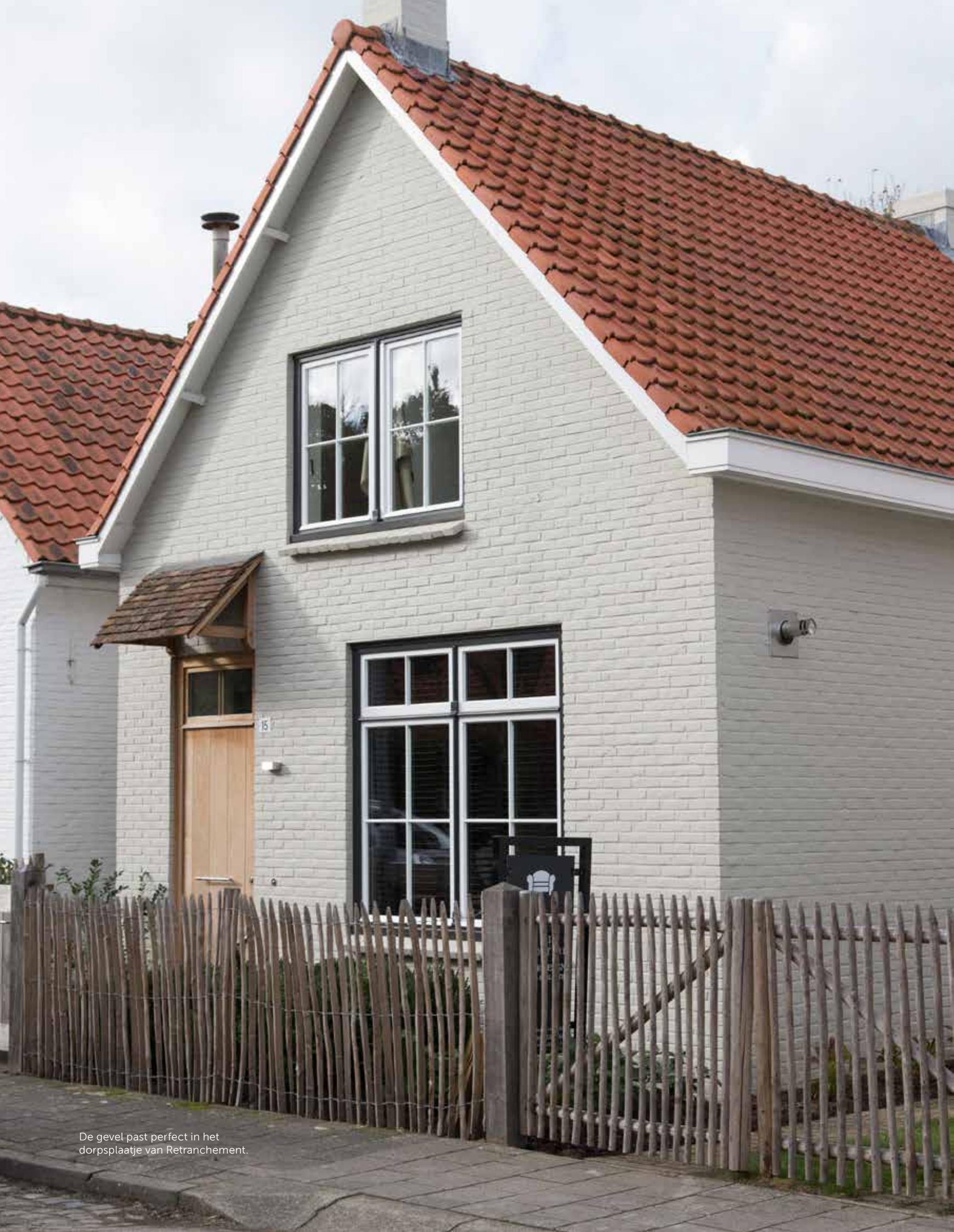
De gevel past perfect in het dorpsplaatje van Retranchement.